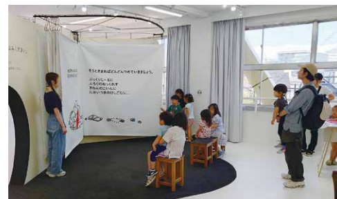
はじっこライブラリー