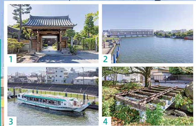
①江戸川区で最も古い日蓮宗寺院と言われる「金嶋山妙覚寺」②新今井橋から望む井水門 ③屋形船も楽しめます ④一之江親水公園にある「城東電車」の線路跡

「一之江」の名は、江戸川沿いに位置する最初の入江に由来すると言われています。この地域は水運や農業など川とともに発展してきました。その後、1986年都営新宿線・一之江駅の開業に伴い、急速に宅地化が進みました。新宿まで直通約30分という利便性を持ちながらも、親水公園などの水辺文化が今なお静かに息づく自然と歴史が調和した街です。